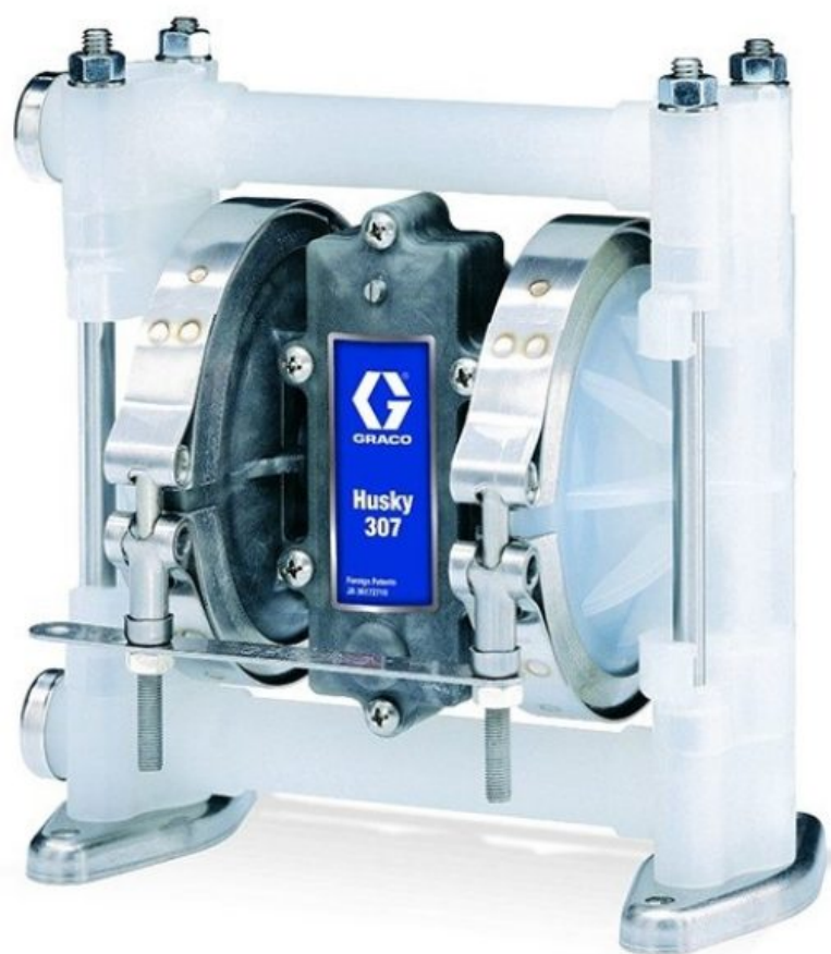
Стандартный насос Husky 307 из полипропилена, BSP 3/8 дюйма, центральная секция: полипропилен, седла: полипропилен, шары: фторопла...