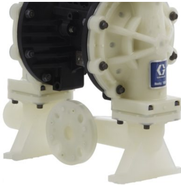
Husky 1050 — насос из полипропилена, центральный фланец, счетчик импульсов, центральная секция: полипропилен, седла: полипропилен,...