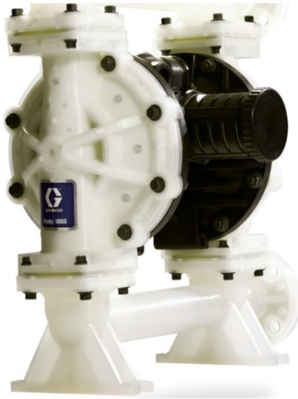
Husky 1050 — насос из полипропилена; торцевой фланец; удаленное управление, центральная секция из полипропилена; седла: нерж. стал...