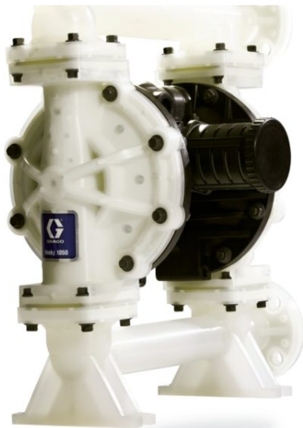
Насос Husky 1050 из полипропилена, NPT, торцевой фланец, центральная секция: полипропилен, седла: сантопрен, шары: сантопрен, мемб...