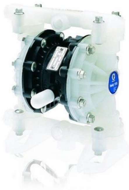
Насос с удаленным управлением Husky 515 из полипропилена (резьба BSP 1/2 дюйма), центральная секция из полипропилена, седла из пол...