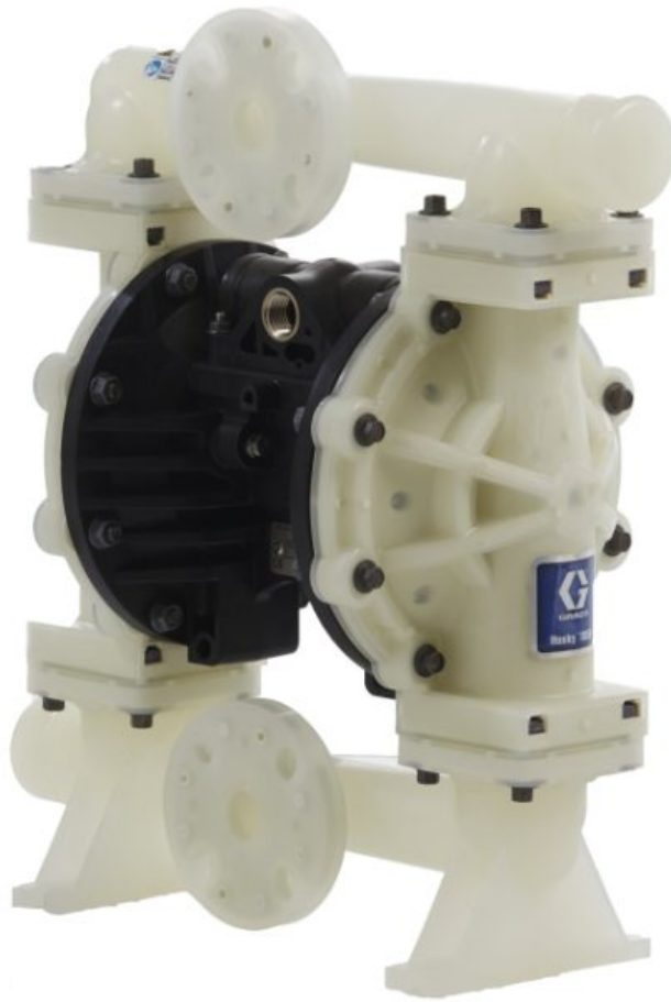
Husky 1050 — насос из полипропилена, NPT, центральный фланец, центральная секция: полипропилен, седла: нерж. сталь, шары: сантопре...