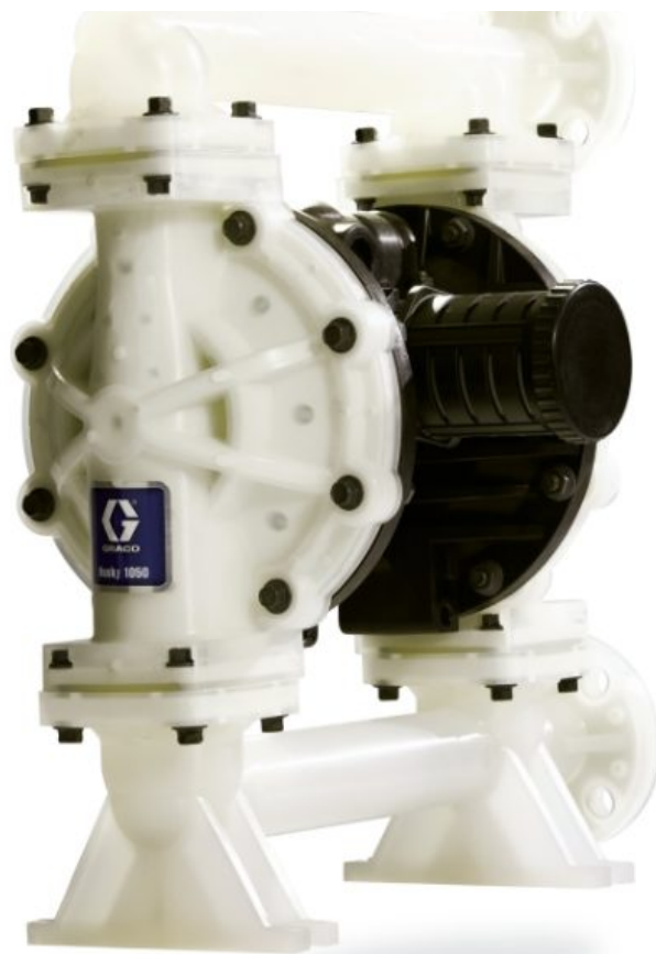
Husky 1050 — насос из полипропилена, торцевой фланец, счетчик импульсов, центральная секция: полипропилен, седла: нерж. сталь, шар...