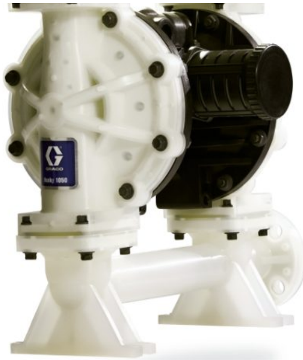
Husky 1050 — насос из полипропилена, торцевой фланец, DataTrak, центральная секция: полипропилен, седла: нерж. сталь, шары: сантоп...