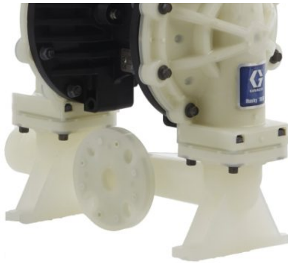
Husky 1050 — насос из полипропилена, NPT, центральный фланец, центральная секция: полипропилен, седла: сантопрен, шары: сантопрен,...