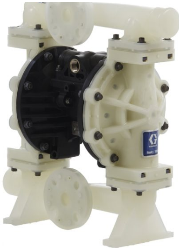
Husky 1050 — насос из полипропилена, NPT, центральный фланец, центральная секция: полипропилен, седла: нерж. сталь, шары: нерж. ст...