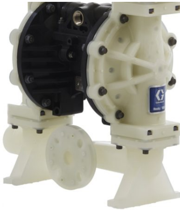
Husky 1050 — насос из полипропилена, центральный фланец, счетчик импульсов, центральная секция: полипропилен, седла: полипропилен,...