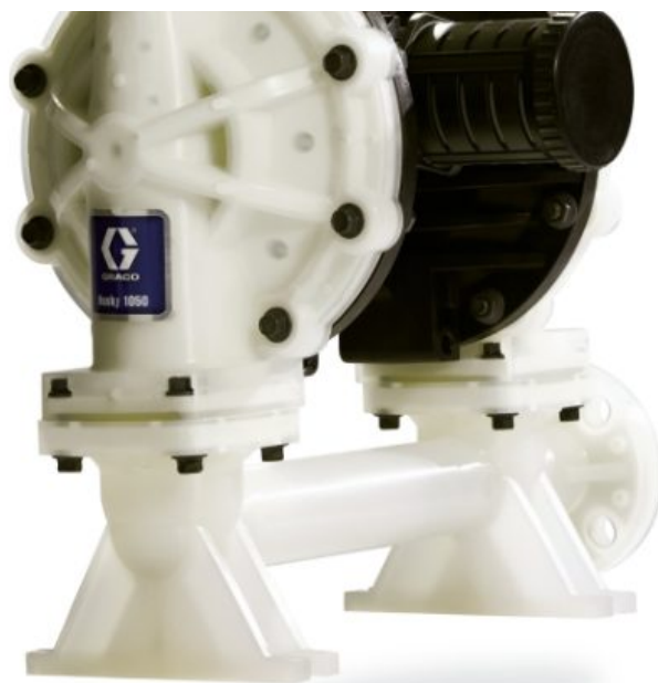
Husky 1050 — насос из полипропилена, торцевой фланец, DataTrak, центральная секция: полипропилен, седла: нерж. сталь, шары: ПТФЭ, ...