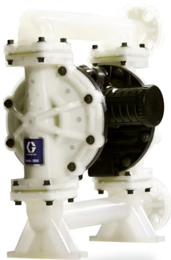
Husky 1050 — насос из полипропилена, торцевой фланец, DataTrak, центральная секция: полипропилен, седла: нерж. сталь, шары: нерж. ...